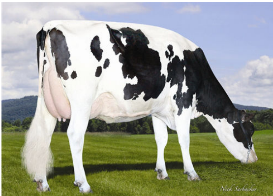
DEER RUN EMPRESS 8465