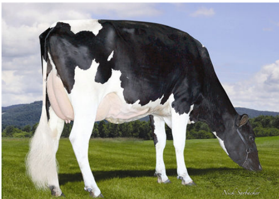
DEER RUN EMPRESS 8458