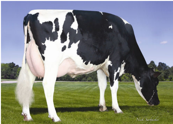
AR-JOY EMPRESS LEXUS